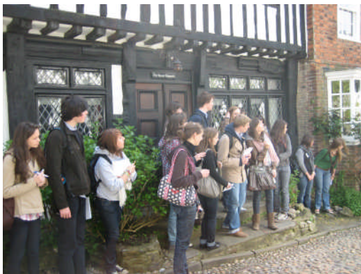
Visite guidée et rallye à Rye