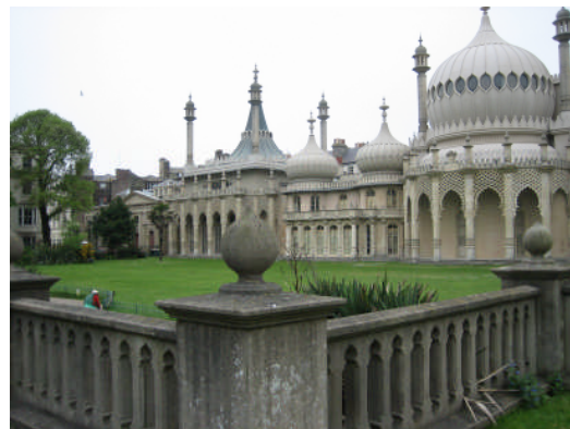
Royal Pavilion à Brighton