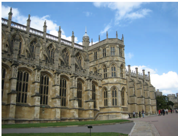
La Chapelle Royale à Windsor

Parmi les incontournables, il y a (eu) notre tour de la ville à bord de la Frégate avec les commentaires de madame Tollemache, les photos complices chez madame Tussaud, les dorures et le faste de Windsor et de Hampton Court, l'imposante Tour de Londres tellement chargée d'histoire et d'histoires, les sculptures du Parthénon et autres objets d'honteuses rapines au British Museum (dont une certaine Florefe Bible ), le mythique stade de Wembley, les couloirs obscurs et peu rassurants du London Dungeon et, aussi, les rallyes ! Des épreuves qui impliquent de la part de chacun un plongeon dans la langue. Finis les enregistrements aux accents oxfordiens de la classe. C'est à l'homme de la rue qu'il faut s'adresser. Et ça, ça vaut (enfin, presque...) toutes les leçons d'anglais du monde.